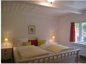
Ein Schlafzimmer mit großem Doppelbett im Erdgeschoss