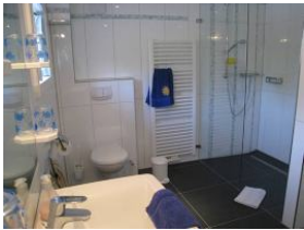
Das großzügige Duschbad im Erdgeschoss mit.....