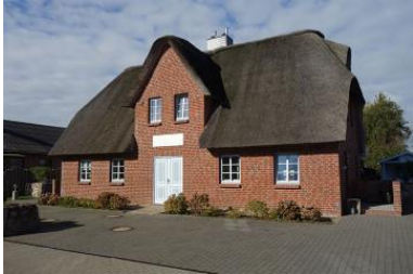
Das Doppelhaus Golfoase, Haus 1 befindet sich rechts

Die Unterkunft verteilt sich über EG und 1.OG.