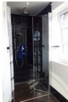
...die bodengleiche Duschkabine