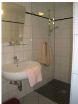
... einer Dusche ohne Wanne, Ecken und Kanten.