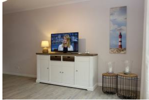
...TV Gerät und DVD Player ....