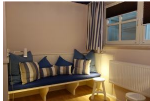
...herrlicher "Chillbank" !