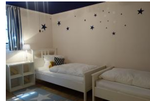
Das Schlafzimmer in der U 20 Zone mit 2 Einzelbetten 90x200cm, Sternenhimmel.....