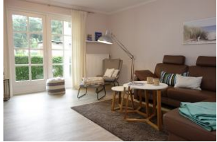
Das Wohnzimmer mit gemütlichem Leseplatz, großer Eckcouch....