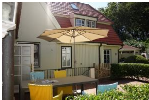
Die Terrasse mit großem Tisch und herrlich bequemen Sesseln.