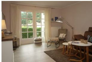
...hier noch einmal das Wohnzimmer..