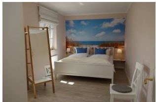
Das Elternschlafzimmer mit Nordseefeeing ....