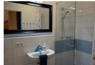
... ein Duschbad mit großer, bodengleicher Duschkabine, Handwaschbecken und Toilette