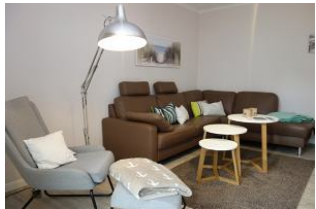
... hier noch einmal die Couch !