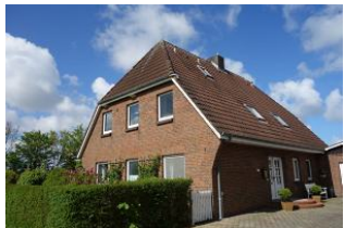
Die Ferienwohnungen Ebbe und Flut befinden sich im 1.OG

Unser Gezeitenhus bietet zwei Wohnung für 2-4 Personen. Die Wohnung 2 - Flut ist etwas größer als die "Ebbe" verfügt über 2 Schlafzimmer, eines mit großem Doppelbett, eines mit Doppelschlafcouch, Küche, Bad und natürlich einem gemütlichen Wohnzimmer. Auch in dieser Wohnung finden Sie nordische, klare Linien in der Einrichtung, die an Sommer, Sand und Meer erinnern. Treten Sie ein und genießen Sie Föhr! Im Garten befindet sich ein möblierter Terrassenplatz, der von den Mietern beider Wohnungen zu nutzen ist..