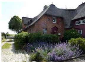
Der Hahnenhof. Der Eingang zur Wohnung 6 befindet sich links am Haus , kurz vor dem weißen Tor.

Großes eingewachsenes Areal mit insgesamt 6 Ferienwohnungen. Wir bieten Ihnen hier die Wohnung 6 für 4 Personen an. Im Erdgeschoß der große Wohnraum mit Kamin und Essplatz. Austritt zur Terrasse und dem Garten. Sep. Küche, ebenfalls mit Essplatz. Duschbad. Im Obergeschoß zwei Doppelschlafzimmer und ein kleines Duschbad. Das Haus wurde in den letzten 2 Jahren renoviert, neu möbliert und mit viel Liebe zum Detail für Sie eingerichtet und dekoriert. Keine Teppichböden mehr. Wer Ruhe sucht, lange Spaziergänge durch die Marsch liebt, wohnt hier genau richtig.