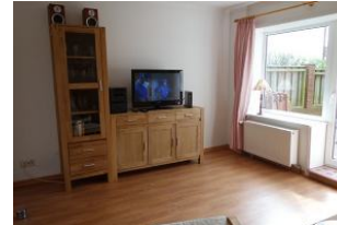
Grosses Fenster und Tür zur Terrasse