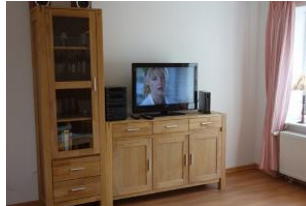
Die Technik darf natürlich auch nicht fehlen....