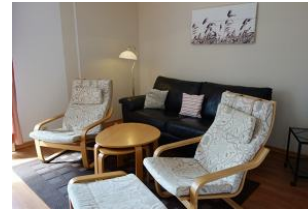
Das Wohnzimmer mit Couch und gemütlichen Sesseln.