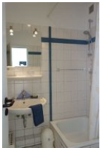
Das Duschbad, nicht im Bild die Toilette