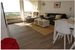
Das Wohnzimmer im Gänze