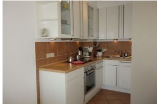
Die offene Küche beinhaltet alles, "was man so braucht"