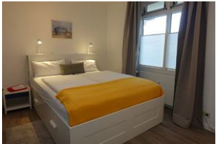
Das Doppelbett misst 180x200cm, kein Fußteil