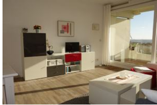
Sideboard mit TV, rechts der Austritt auf den Balkon