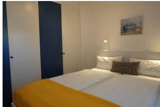
Genügend Stauraum für Kofferinhalte