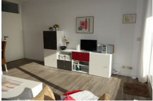
Sideboard mit TV, links im Hintergrund die Tür zum Flur.