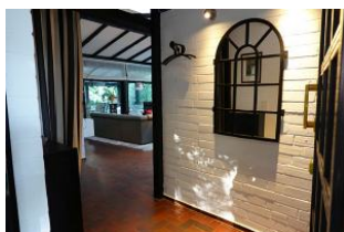
...treten Sie ein und lassen sich verzaubern