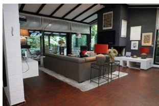
...die große Couchecke