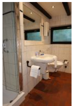
Ein Bad mit Handwaschbecken, Toilette und ..