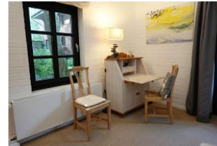
Das Arbeitszimmer für die ganz Fleissigen...