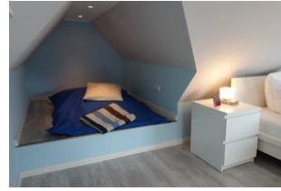
Der Clou: die Kinderhöhle