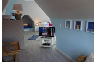
...wer mag, kann den TV-Tisch auch zum Bett drehen !