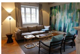
Große, gemütliche Couch, 2 Sessel, nicht im Bild der Kamin