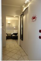
...vom Wohnzimmer am Bad vorbei ins Schlafzimmer !

Zwei Garderoben und ein Stuhl bieten genügend Möglichkeiten Kleidung auszulüften