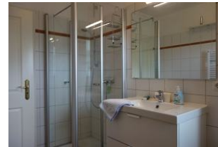
Das Duschbad mit Handwaschbecken und Dusche, nicht im Bild die Toilette + Waschmaschine und Fenster