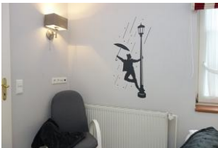
The Raining Man - der gute-Laune-Mann !