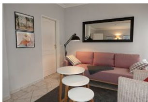
...hier noch einmal die Couch, die Tür führt zum Schlaftrakt.