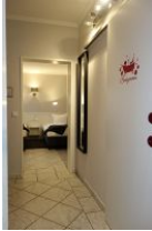
...vom Wohnzimmer am Bad vorbei ins Schlafzimmer !

Zwei Garderoben und ein Stuhl bieten genügend Möglichkeiten Kleidung auszulüften