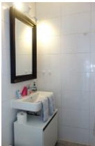
Handwaschbecken und großer Spiegel, gute Beleuchtung