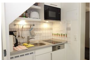
Die kleine Küchenzeile mit Geschirrspüler und Mikrowelle

Ruhig gelegen, inmitten unseres kleinen Städtchens Wyk finden Sie unser Haus Hallig Hooge, welches insgesamt 7 Wohnungen für jeweils zwei Personen beherbergt. Das Appartement Langeneß ist größer als die anderen Erdgeschossappartements und bietet daher ein wenig mehr Freiraum. In dem großzügigen Wohnraum mit Essplatz, der kleinen Einbauküche, dem Schlafzimmer mit Einzelbetten, und dem Duschbad kann man auch einen längeren Aufenthalt genießen, ohne sich eingeeengt zu fühlen. Ein großer Kleiderschrank im Flur vor dem Schlafzimmer bietet genügend Platz für Garderobe.