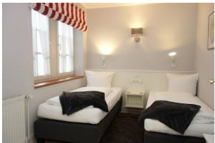
Das Schlafzimmer mit 2 Einzelbetten 90x200cm nicht im Bild, der große Kleiderschrank

Zwei Garderoben und ein Stuhl bieten genügend Möglichkeiten Kleidung auszulüften