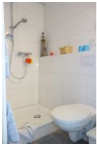
Die Dusche und Toilette, nicht im Bild das Handwaschbecken.