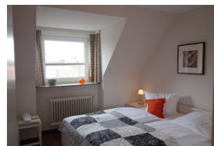
Das Schlafzimmer mit Doppelbett (180x200cm)