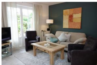
...vorn links im Bild, das TV -Gerät