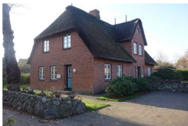
Das Ferienhaus OHI Dörp 49f in Wrixum im Herbst

Die Unterkunft verteilt sich über EG und EG.