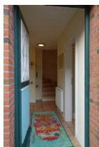
Treten Sie ein und fühlen sich einfach wohl....

...wer mag nicht gern beim aufwachen den Geruch von frisch gebackenen Brötchen riechen ??? Sie müssen die Backwaren noch selbst holen, aber es sind nur ein paar Schritte bis zum Bäcker Hansen Das Haus Kastanie bietet eine moderne Doppelhaushälfte für 4 Personen + Baby (im Notfall gibt es auch noch zwei weitere Schlafplätze) Eine voll eingerichtete Küche, Wohnzimmer mit großzügigem Essplatz, 2 Duschbädern und zwei Schlafzimmern ! Hier findet die ganze Familie Platz. Und Ihre Fellnase darf auch mit. Kommen Sie, schauen Sie...und fühlen Sie sich einfach wohl !