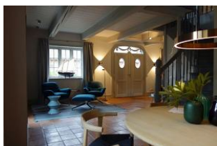
Der Blick zur Haustür

Dieses traumhafte Hausteil wurde im Frühjahr 2020 komplett saniert und neu eingerichtet. Seien Sie gespannt auf ein großzügiges Erdgeschoß mit offenen Räumen ohne störende Türen (friesischer Rundgang), tolles Ambiente, moderne Einrichtung, technische Raffinessen (5x Sonos Box) Küchenschränke mit Touchfunktion, Vollflächiger Induktionsherd, Sauna im Bad im OG, zwei Schlafzimmer mit großen Doppelbetten, eins mit zweitem TV Gerät. Durch dies Haus muß man einmal durchgehen, alles ausprobieren, sich setzen und auf sich wirken lassen. Toll, seien Sie gespannt auf dieses 5 Sterne Haus !