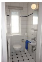
Das Gäste-WC im Erdgeschoss