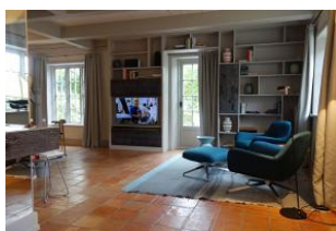
Blick auf Relaxessel und das TV Gerät (voll schwenkbar) im Hintergrund der Essplatz