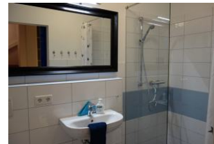
... ein Duschbad mit großer, bodengleicher Duschkabine, Handwaschbecken und Toilette