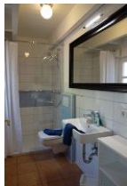
Das Duschbad im Erdgeschoß