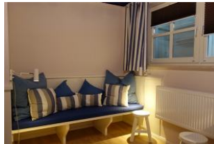
...herrlicher "Chillbank" !