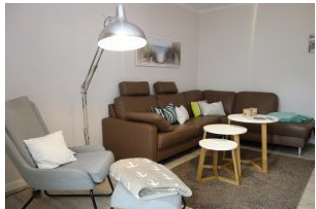
... hier noch einmal die Couch !