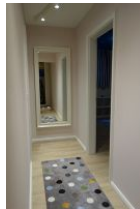
Der Flur führt rechts ins Schlafzimmer, links ins Spielzimmer