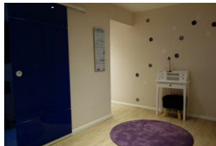
Hinter der Glastür verbirgt sich ....