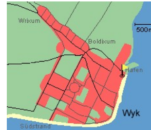
Entfernungen, zirka: zum Bäcker 30 m, zur Einkaufsmöglichkeit 350 m, zum Flugplatz 3,0 km, zum Golfplatz 3,0 km, zum Hafen 600 m, zum Meer 50 m, zum Badestrand 50 m, zum Ortszentrum 50 m