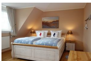
Das Elternschlafzimmer mit großem Doppelbett (180x200cm)