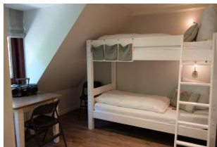
Ein Schlafzimmer mit Etagenbett.