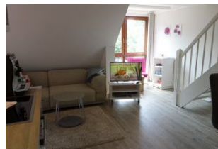
Das Wohnzimmer, die Treppe führt in das Schlafzimmer im Dachgeschoß