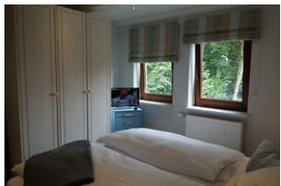
...Einbauschränk und kleinem TV-Gerät