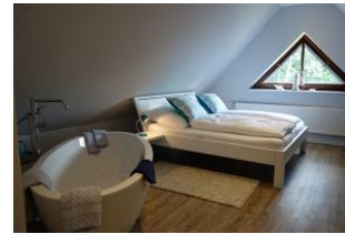
...WOW ... Das Schlafzimmer im Dachgeschoß