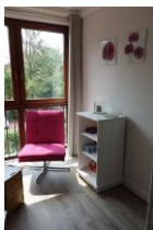
Schmökerstunde am Fenster.....