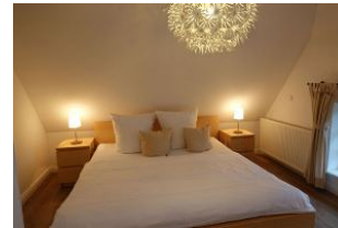
Das Schlafzimmer im Obergeschoß...