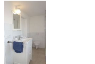
...Waschbecken und Toilette