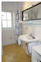
Das Bad mit...