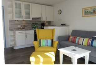
....wer mag sich hier nicht niederlassen ?