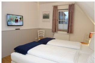
Das zweite TV Gerät im Schlafzimmer