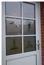
...Herzlich Willkommen !

Unsere kleine Haushälfte am Wyker Südstrand steht nur wenige Schritte vom Leuchtturm entfernt. Sie können das Meer zwar nicht sehen, aber hören und vielleicht auch riechen. Für 2 Personen ideal, aber auch 4 Personen finden hier Platz für einen erholsamen Familienurlaub. Wohnzimmer und Küche - total gemütlich. Festnetz Flat und WLAN Verbindung sowie die Nutzung der Waschmaschine sind kostenfrei.