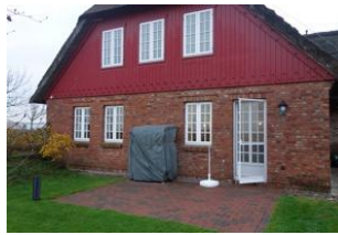
Die Terrasse im Herbst.