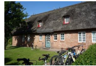
Der Eingang an der Seite führt zu den Wohnungen 1, 2, 4 und 5, hier befindet sich auch der Fahrradparkplatz