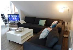
...hier finden alle Familienmitglieder ein Plätzchen