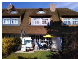
Die Terrasse bei herrlichem Wetter.....