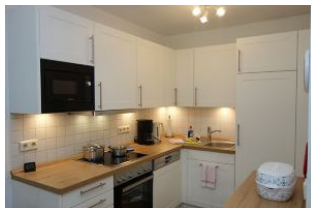
...mit viel Platz für Küchenutensilien