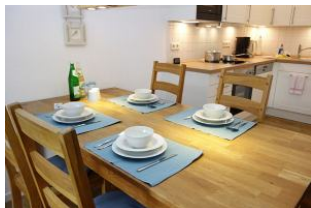
....nehmen Sie Platz, sieht aus, als gäbe es bald etwas zu essen.