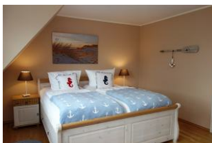
....noch einmal das Bett.