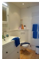
Das Badezimmer im Obergeschoß mit.....