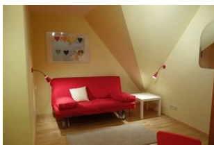
Das Durchgangszimmer mit moderner Couch zum lesen und klönen....