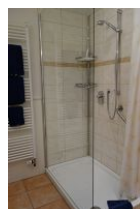
.. großer Dusche, Echtglaswand.