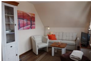
Der Wohnbereich für gemütliche Stunden