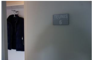
Die Wohnung 6 befindet sich im 2.OG links