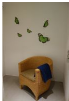
...und gemütlichem Sessel zum ausruhen.