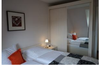
...und großem Kleiderschrank