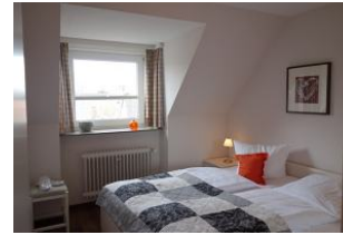
Das Schlafzimmer mit Doppelbett (180x200cm)