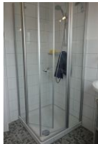
...und flacher Duschkabine.