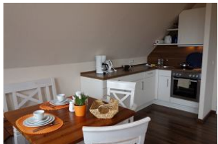
Die offene Küchenzeile mit Essplatz