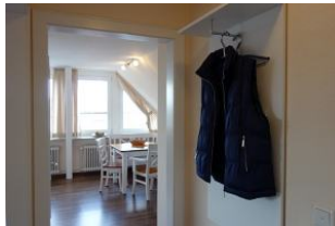
...treten Sie ein ...