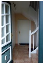
Der Eingang zur Wohnung 3

Das Hus Dikstian in Alkersum mit 5 Wohneinheiten bietet jedem etwas. Hier können Sie mit Ihren Freunden wohnen. Alle zusammen und doch hat jeder sein eigenes Reich.... Die Wohnung 3 verfügt über 2 Schlafzimmer mit 4 normalgroßen Betten. Der große Wohnraum mit Couch "zum langmachen", Lesesessel, großem Esstisch und Zugang zur Küche sollte der Familienmittelpunkt sein. Ein großzügiges Badezimmer mit Badewanne, Glaswand zum Duschen, sorgen zusätzlich für Wohlfühlambiente. Das Haus steht auf einem großen Grundstück, welches alle Gäste benutzen dürfen, jede Wohnung hat jedoch für sich eine Terrasse. Parkplatz auf dem Grundstück.