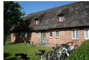
Der Eingang an der Seite führt zu den Wohnungen 1, 2, 4 und 5, hier befindet sich auch der Fahrradparkplatz