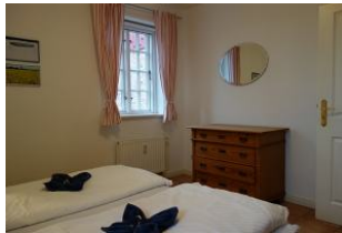
Kommode im Schlafzimmer, nicht im Bild der Kleiderschrank