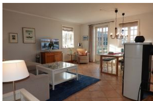
Treten Sie ein...ein herrlicher, oft sonnendurchfluteter Wohnraum erwartet Sie.