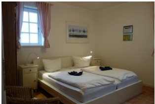
Ein Schlafzimmer mit Doppelbett 180x200cm