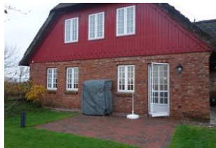
Die Terrasse im Herbst.