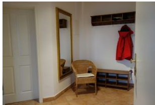
Der Flur mit Garderobe und Schuhablage