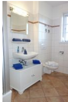
Handwaschbecken, Ablage, Toilette