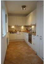
Die sep. Küche vom Wohnzimmer aus zu begehen.