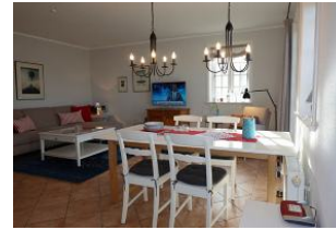
Der Esstisch. Im Hintergrund das TV Gerät und die Couch.