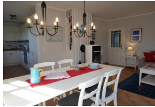
der lange Esstisch, im Hintergrund der Ofen.