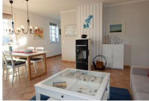
Der Ofen ist mit Holz zu füttern. Links im Hintergrund die Küche.