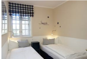
Ein Schlafzimmer mit 2 Einzelbetten (je 90x200cm)