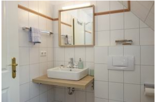
Der Waschtisch im Bad

Entfernungen, zirka: zum Bäcker 150 m, zur Einkaufsmöglichkeit 4,0 km, zum Flugplatz 4,0 km, zum Golfplatz 4,2 km, zum Hafen 4,5 km, zum ÖPNV 200 m, zum Badstrand 4,0 km, zum Ortszentrum 200 m