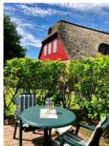
...Tisch und Stühlen.