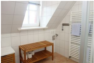
Fenster im Bad, Sitzbank