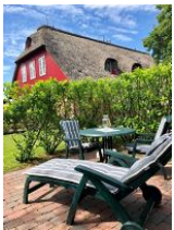
Im großen Garten ein kleines Plätzchen nur für die Wohnung 5 mit Liege und....