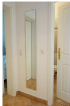
Im Flur ein großer Spiegel