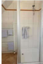
Die Duschkabine und Handtuchheizung