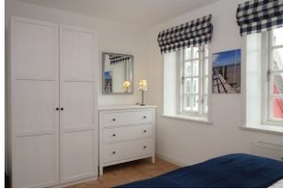
Schrank und Kommode für die Kofferinhalte