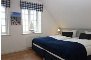
Das Schlafzimmer mit Boxspringbetten, je 90x200cm