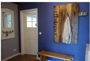
Der Flur mit großer Garderobe...