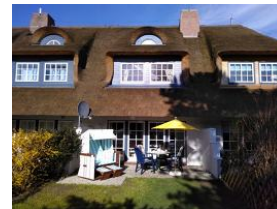
Die Terrasse bei herrlichem Wetter.....