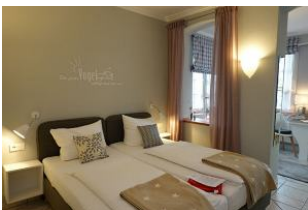
...hier dürfen Sie ausschlafen.