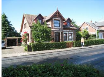
Das Haus Boldixumer Str. 25 in Wyk