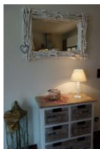
Die Kommode für "düt un dat"

Die Wohnung Klantem in Oldsum ist ein echtes "Schmuckstück". Seien Sie gespannt. Eine urgemütliche großzügige Wohnung für 3 Personen mit herrlicher Süd-West-Terrasse, zwei Schlafzimmern, Duschbad und einem großen Wohn/Essraum mit offener Küche. Genießen Sie die Ruhe unseres "Künstlerdorfes" Oldsum in dem Sie auch Infrastruktur in Form eines Kaufmanns, Speiselokalen und Cafes finden. Zum Strand nach Utersum sind es ca. 3km