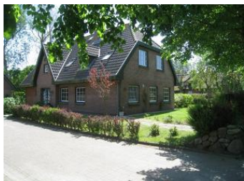
Das Haus 151 in Oldsum