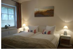
Das Elternschlafzimmer mit großem Doppelbett 180x200 cm