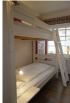
noch einmal die Betten im Kinderzimmer, klein und urgemütlich !