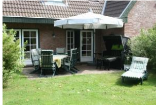
Die herrliche, geschützte Terrasse mit Gartenmöbeln und Strandkorb