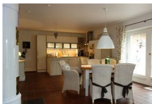
Großer Essplatz mit Blick in die Küche