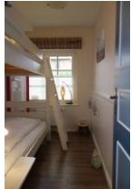
Das kleine Kinderzimmer mit Etagenbett. Ab 2024 wird dort ein Einzelbett stehen, dann können wir nur noch an 3 Personen vermieten.