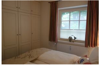
...mit viel Schrankfläche für die Kofferinhalte