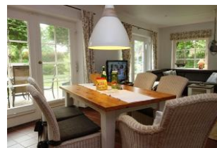
Der Essplatz....zwischen Wohn- und Küchenbereich. Ein herrlicher Ort zum klönen...