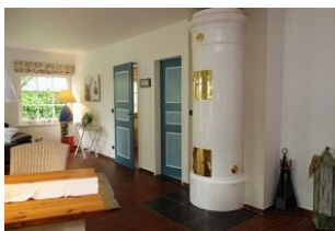
Der Kachelofen für gemütliche Abende