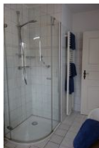
...die Dusche mit Echtglas.....

...und die Toilette, alles in einem Raum.