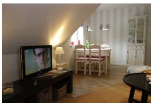
Ein Essplatz am Fenster, hier läßt sich auch wunderbar Urlaubspost erledigen.