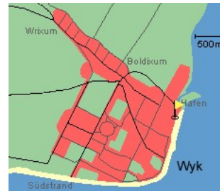
Entfernungen, zirka: zum Bäcker 30 m, zur Einkaufsmöglichkeit 350 m, zum Flugplatz 3,0 km, zum Golfplatz 3,0 km, zum Hafen 600 m, zum Meer 50 m, zum Badestrand 50 m, zum Ortszentrum 50 m