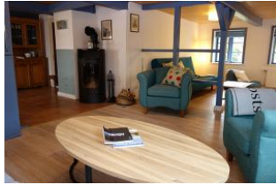
Der dänische Eisenofen