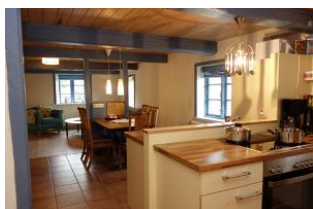
Ein Teil der Küche mit Blick auf den Essplatz und ins Wohnzimmer