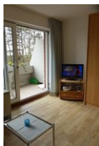
Das TV Gerät und der Zugang zum Balkon