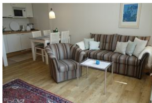
..der Blick zur Küche !