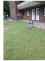
Blumenkübel vor dem Haus.