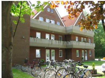
Das Haus Olhörnweg 1 Die Wohnung 15 befindet sich 1.OG