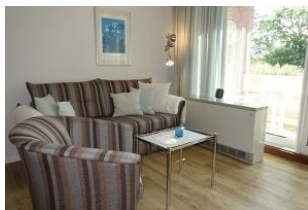
Ein sonnendurchflutetes Wohnzimmer erwartet Sie...