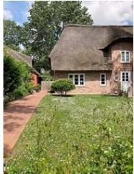
Die linke Hälfte des Hauses Buurnstrat 40 - WattLütt

Die Unterkunft verteilt sich über EG und 1.OG.