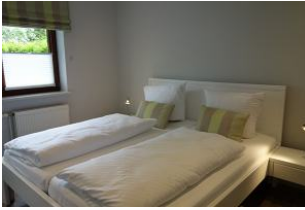
...und das zweite Schlafzimmer mit Doppelbett und..