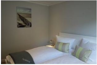
Ein Schlafzimmer mit Doppelbett