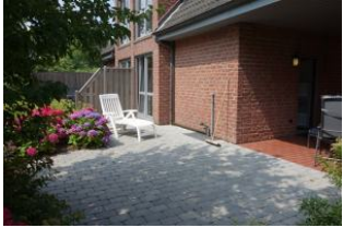
Für das Sonnenbad ein große Terrasse...