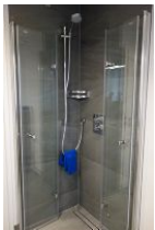
...und Dusche mit Echtglaswand, die komplett weg geklappt werden kann.