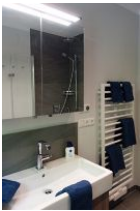
Das Bad mit Handwaschbecken und Toilette (nicht im Bild)....