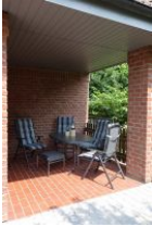
...herrlich, auf der überdachten Terrasse kann man auch Abends lange draußen sitzen...