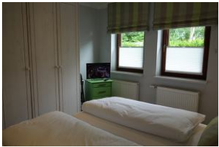
...großem Kleiderschrank und TV-Gerät