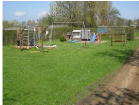
Der Spielplatz auf dem Grundstück, dahinter befindet sich der Parkplatz.