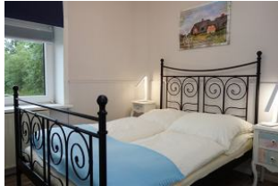
Ein Zimmer mit Doppelbett 160x200cm und ...